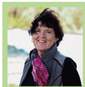
ブローニー・ウェアさん

ここから、後悔が少なくすむためにどうしたらよいかを考えると、「自分はどうあるのが幸せなのか」、「どうあるのが自分らしい生活か」を考えて、それを目標に日々を過ごすことが大事、ということになるかと思えます。